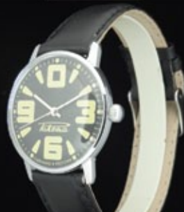
Временная Коллекция / Temporary Collection 2009