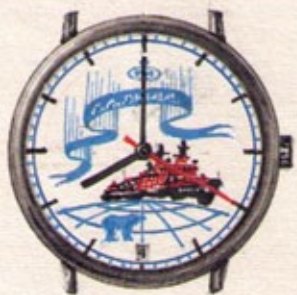
Оригинальная акварель / Original watercolor 1992