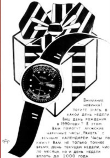
Постер / Poster 1979