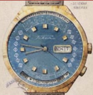
Оригинальная акварель / Original watercolor 1976