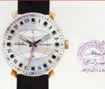
Оригинальная акварель / Original watercolor 1969