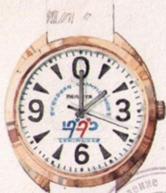
Оригинальная акварель / Original watercolor 1989