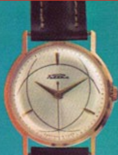
Брошюра / Brochure 1980