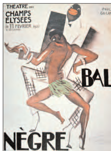
Эйфория между Первой и Второй мировой войной и популярность стиля Арт Деко.

Caesandre, affiche pour le Normandie 1935 - © MOUTON CASSANDE - licence n° 2006-25-06-04 - TM French Line