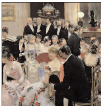
Роскошь, утонченность, любовь к праздникам; Франция конца XIX века.

В этом же году Симон Тиссо-Дюпон набирает несколько талантливых ремесленников и открывает престижную кожевенную мастерскую. Мастерская выпускает портмоне и "марокены" – портфели-дипломаты с инициалами высокопоставленных чиновников. В изысканном Париже этой эпохи Симон Тиссо-Дюпон быстро добивается успеха. В скором времени его мастерская становится поставщиком магазинов Лувра, которые на тот момент были самым известным местом продажи роскошных аксессуаров.