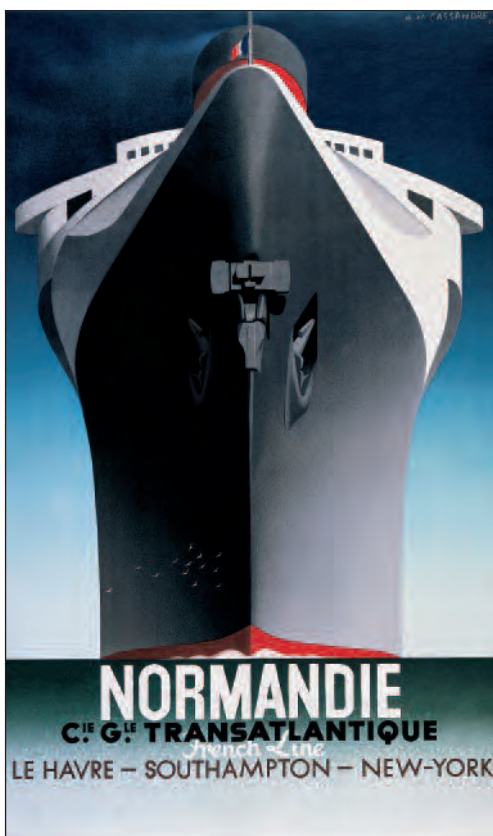
В эпоху трансатлантических поездок путешествие превращается в искусство.

Последний саквояж из кожи цвета лаванды был изготовлен в 1947 году для принцессы Елизаветы, будущей королевы, по случаю ее свадьбы. Сколько стоит саквояж компании S.T. Dupont? Сотрудники компании того времени дают ответ: столько же, сколько стоит дом.