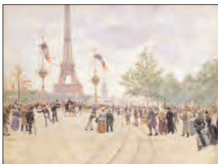
1889 год: Открытие Эйфелевой башни. Париж становится Парижем!